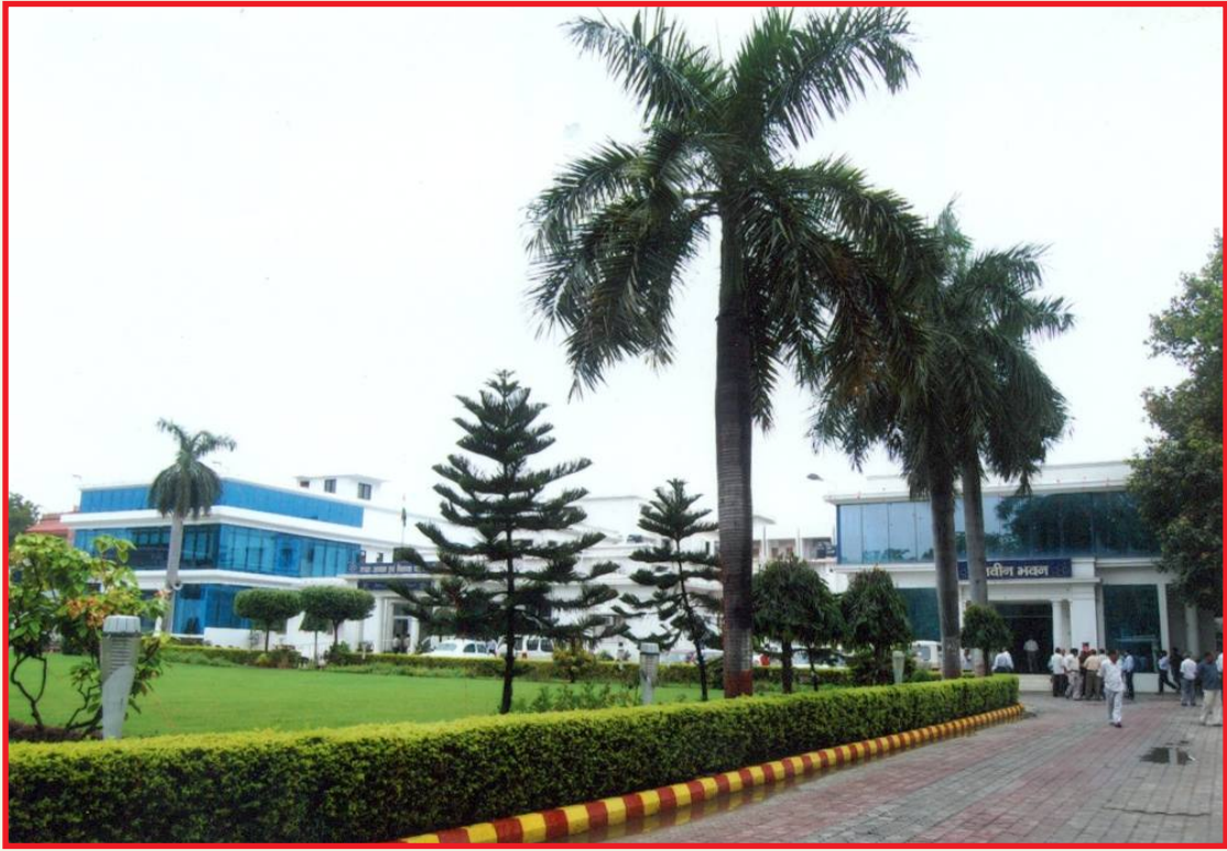
उ.प्र. आवास एवं विकास परिषद, मुख्यालय